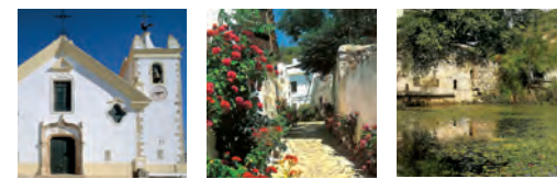
Igreja Matriz de Alte