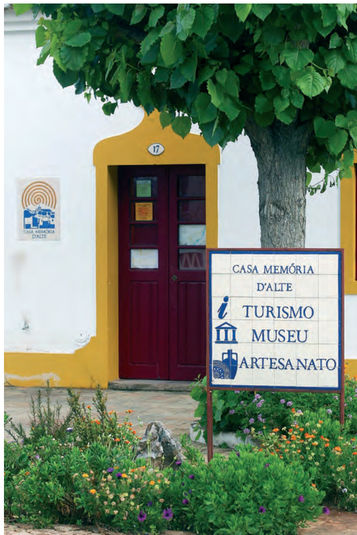
Casa da Memória d'Alte