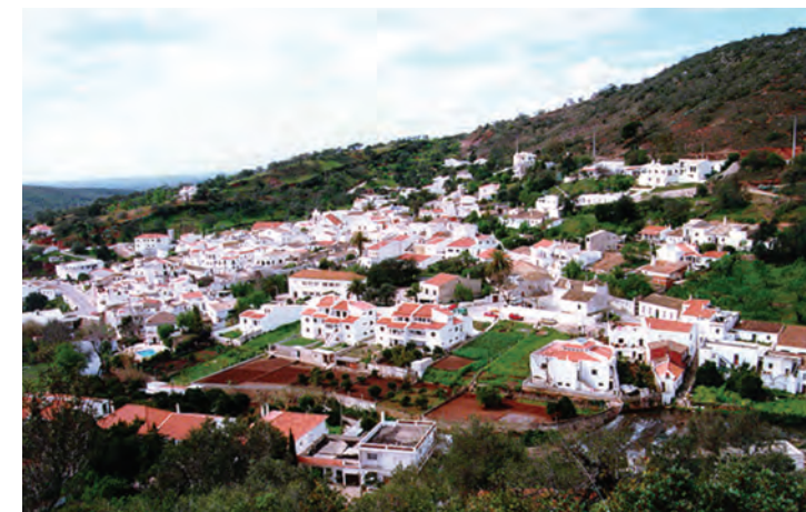
Vista de Alte

Na Fonte Pequena é homenageado o poeta altense Cândido Guerreiro, num espaço harmonioso onde o verde e a frescura convidam a momentos de lazer